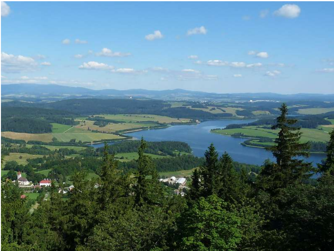
Vodní nádrž Slezská Harta

Strategický dokument DSO Bruntálsko pro období let 2019- 2020 byl schválen na 1. zasedání Členské schůze svazku Bruntálsko dne 21.2.2019, č. usnesení S10/01/2019